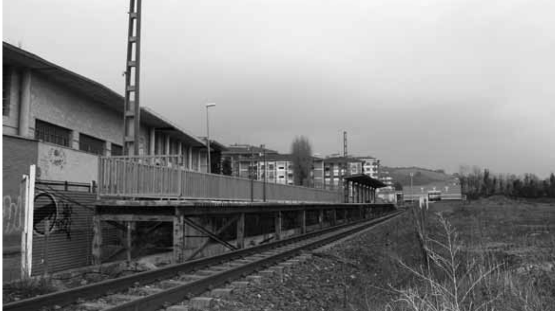
Bertan behera utzita, abandonatuta egon da trenbidearen inguru hau azkenaldian.

Ahalik eta lasterren espazio hori erabilera publikora zabaldu gura du udalak