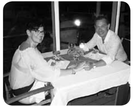
> Astelehenean Arantzaren eta Martinen urteguna izango da. Zorionak etxekoan partez, eta ospatu egizue merezi duzuen bezala.