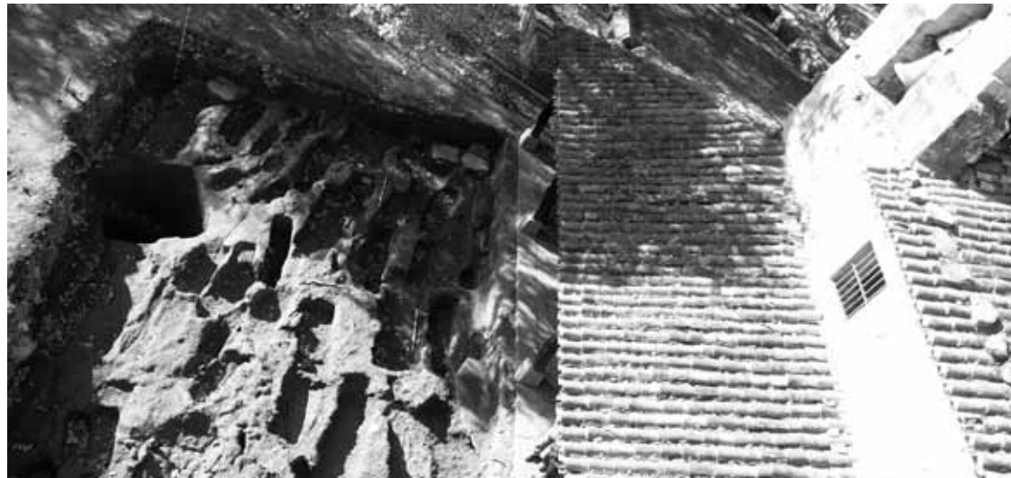
Argiñetan lanak egingo dituzte herritarren laguntzagaz.