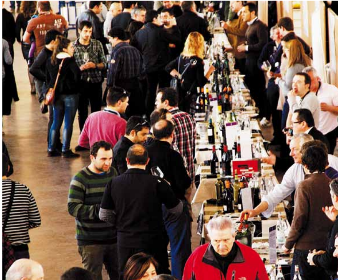
1.200 lagun bildu zituen iaz Ardo Saltsan azokak.

Autobus linea horregaz lotuta hainbat kexa egin izan dituzte erabiltzaileek. Durango udalbatzar batera joan ziren horietako bi, 160 erabiltzailearen izenean, udalari inplikatu dadi- la eskatzeko. Eta horren ondorioz etorri da eztabaida Araban. Iaz, Otxandioko herritarrek ere protestak egin zituzten.