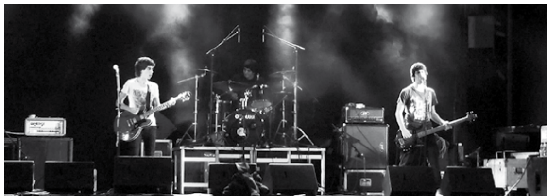
The Mockers Durangoko taldea izan da, beste zortzi taldegaz batera, aukeratuetaiko bat.

Bederatzi talde ariko dira eskualdeko maketa lehiaketaren bigarren edizioan