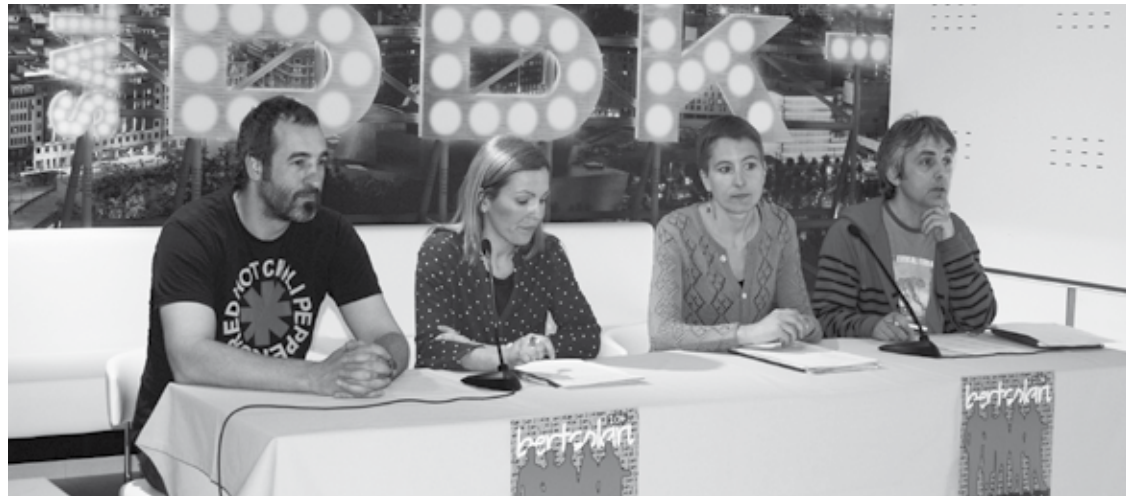
Bilbon egin zuten astelehenean sariketa aurkezteko prentsaurrekoa.

Martitzenean abiatu zuten Bizkaiko Bertsolari Gazteen BBK Sariketa