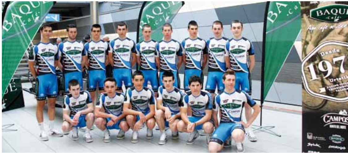
Cafés Baqué-Conservas Camposen aurtengo taldea, Durangoko tren estazioan atzo egindako aurkezpenean.

Cafés Baqué-Conservas Campos taldea aurkeztu dute; nazioartean hainbat lasterketa lehiatuko ditu, tartean Lieja-Bastogne-Lieja klasikoa