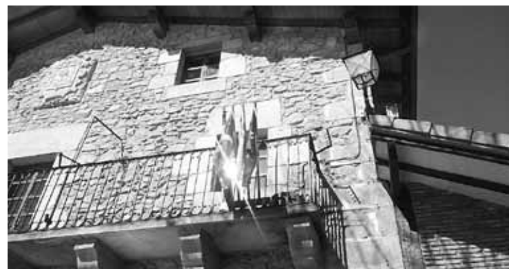
Espainiako bandera Garaikoagaz, ikurrinagaz eta Europakoagaz ipini dute.