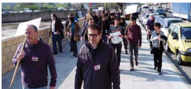
Iurretara heldu zen martxa, martitzenean.

Ermutik irten zen, Zaldibar, Berriz, Abadiño, Durango eta Iurretatik igaro, eta Zornotzan amaitu zuen ibilbidea. Durangon elkarretaratzea egin zuten martxako parte-hartzaileek, eta Zornotzan manifestazioa. Hilaren 20an amaituko da martxa