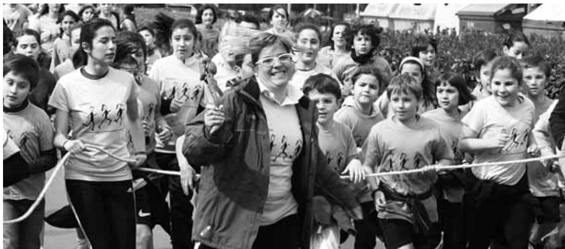
Iazko Lilakrosean, Tabirako saskibaloi taldekoak lekukoa erroten.