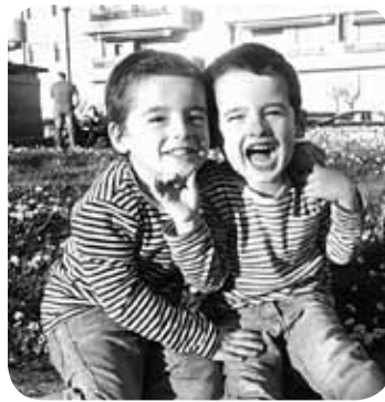
> Eguztenezko lau urte egin dituzte Ametzek eta Sugarrek . Zorionak familia guztixen partez. Mosu potolo bana bixoi!