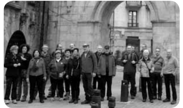
> Bizidun nagusien elkarte a ibilbideak egiten hasi da, Durangaldeko txokoak eta euren historia ezagutzeko. GR Mikeldi ibilbidea etapaka egiten dabilta orain. Barikuro geratzen dira elkarrekin ibilaldiak egiteko.