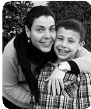
> Oierrek martitzenean zazpi urte egin zituen. Saioak gaur egingo ditu 33. Zorionak bioi!

> Hamabostean behin jasotako zorion-agurren artean tarta bat zotz egingo dugu. Zozketan parte hartzeko bidali kontakturako datuak zorion agurrarekin batera.