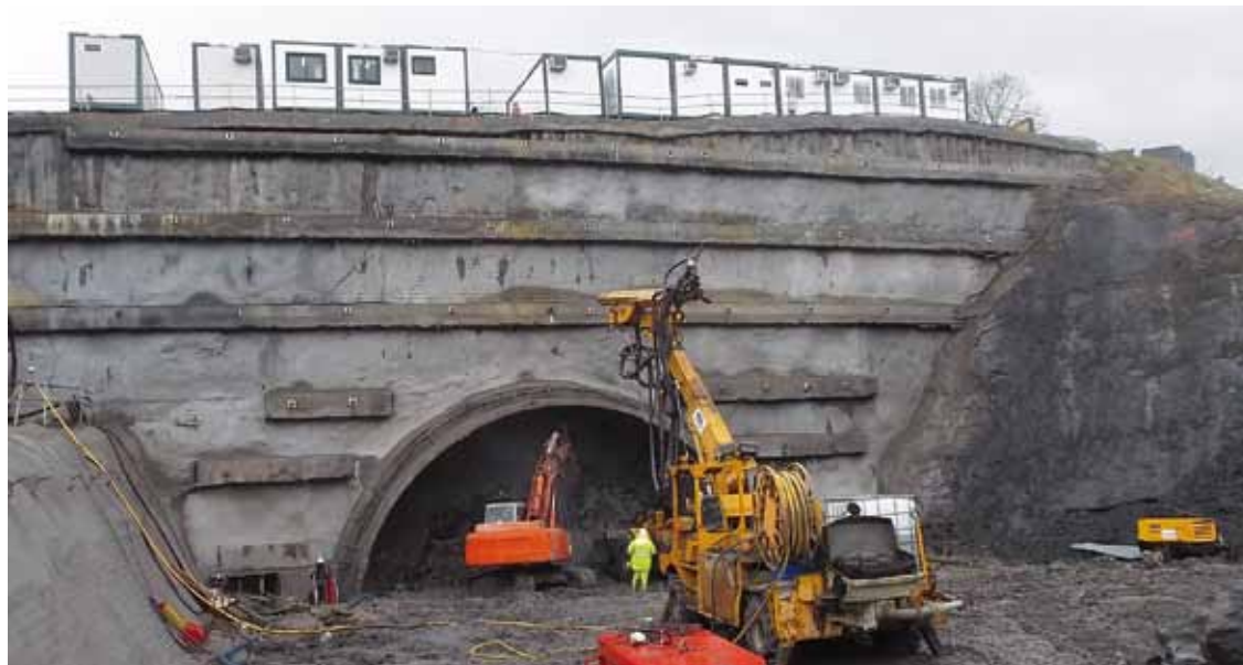
Gaztelua auzoaren inguruan tunela zabaltzen hasi ziren, joan zen astean.