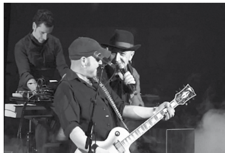
'vimeo.com/tag:doctor+deseo' helbidean dago dokumentalaren trailerra ikusgai.

grabazioak bildu dituzte bertan. Hiru kanta berri daude diskoan: Equivocarse hasta acertar , Aunque siga siendo de noche , eta Busco en tus labios kantaren bertsiok berria. Hain zuen, diskoari izena ematen dion kantu horrekin lehiaketa bat irabazita hasi zen Doctor Deseo, 1986. urtean.