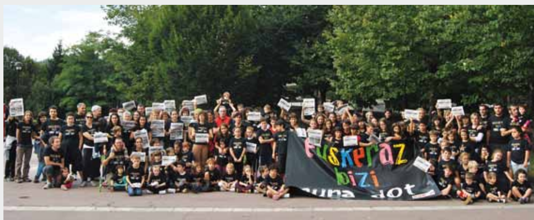
Euskararen Egunean ateratako argazkia, ‘Anboto’ eskuetan dutela.

Zornotzar talde batek sinadurak bildu ditu ‘Anboto’ herrira zabaltzeko