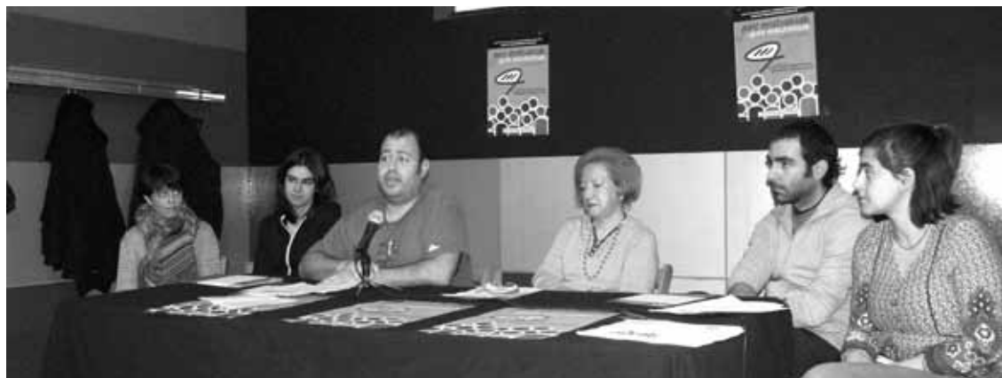
Plateruenean aurkeztu zuten, joan zen zapatuan, Euskal Herriko Eskubide Sozialen Kartaren inguruko eztabaida