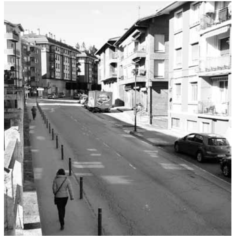
Lau fasetan egingo dituzte Berrizko kale nagusiko obrak.

Gizarte ongizate alorrera iaz baino 22.000 euro gehiago bideratuko ditu Berrizko Udalak.