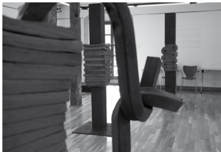
Besteak beste, Florentzian edo Berlingen erakutsitakoak dira lanak.

Martxoaren 30era arte izango da erakusketa zabalik