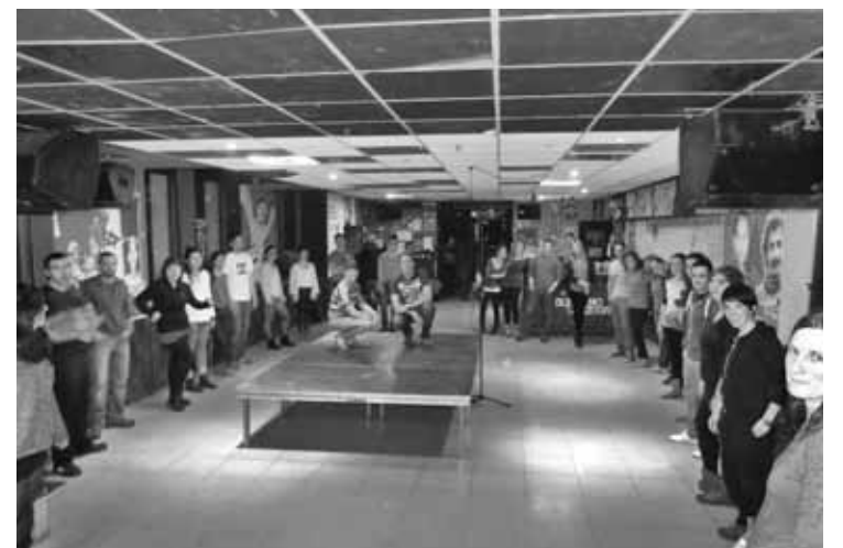
Astelehenean, gaztetxean egindako dantza saioa.

Gaztetxeko salsa eta bachata ikastaroak arrakasta eduki du; 45 lagun batu ziren lehen saioetan