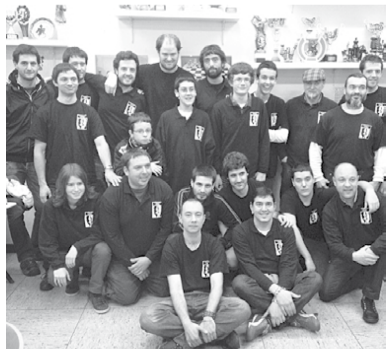
Abadiño Xake Taldea osatzen duten xakelarien familia argazkia.

Oro har, Abadiño klub guztiak maila handian dabilta aurten. Esaterako, Bigarren Mailan Abadiño C igoera postuan dago, eta asteburuan Conteneo lideraren aurka lehiatuko da. Hirugarren mailatik hiru talde igoko dira, eta baliteke hirurak Durangaldekoak izatea: Abadiño D, Abadiño E eta Larrasoloeta B. Bizkaia mailako ligetan jardunaldi bi falta dira amaierarako.