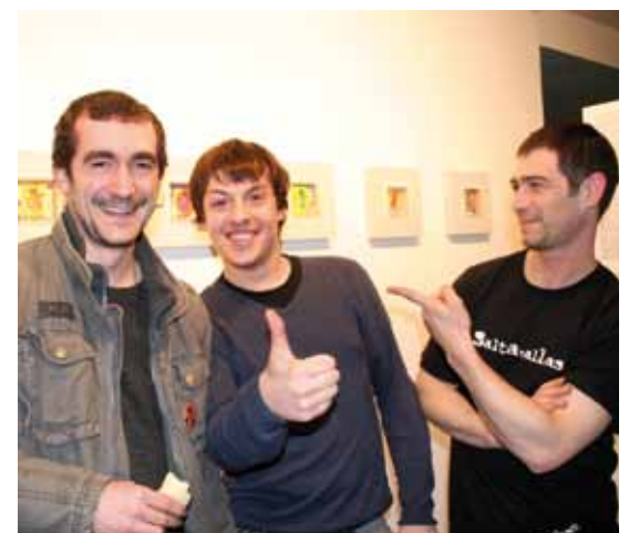
Primeros Auxilios musika taldeko kideak