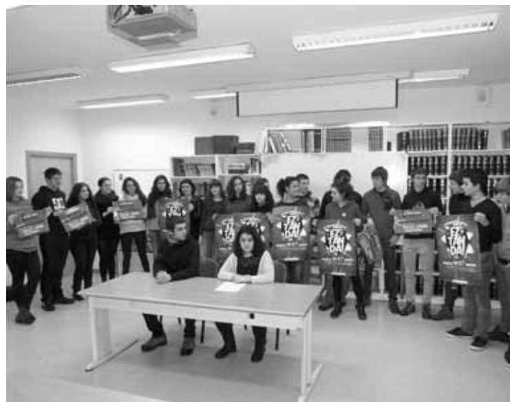
Ikasleek manifestaziorako deia luzatu zuten, martitzenean.

diote ekimenari: “Ezinbestekoa da egungo ereduak errotoz irauliko duen ikasle mugimendua leherraraztea”. Eta dinamika horren harira egin dute manifestaziorako deialdia. Ikasleek gainera, LOMCE legearen kontra dauden herritar guztiak animatu dituzte parte hartzera.