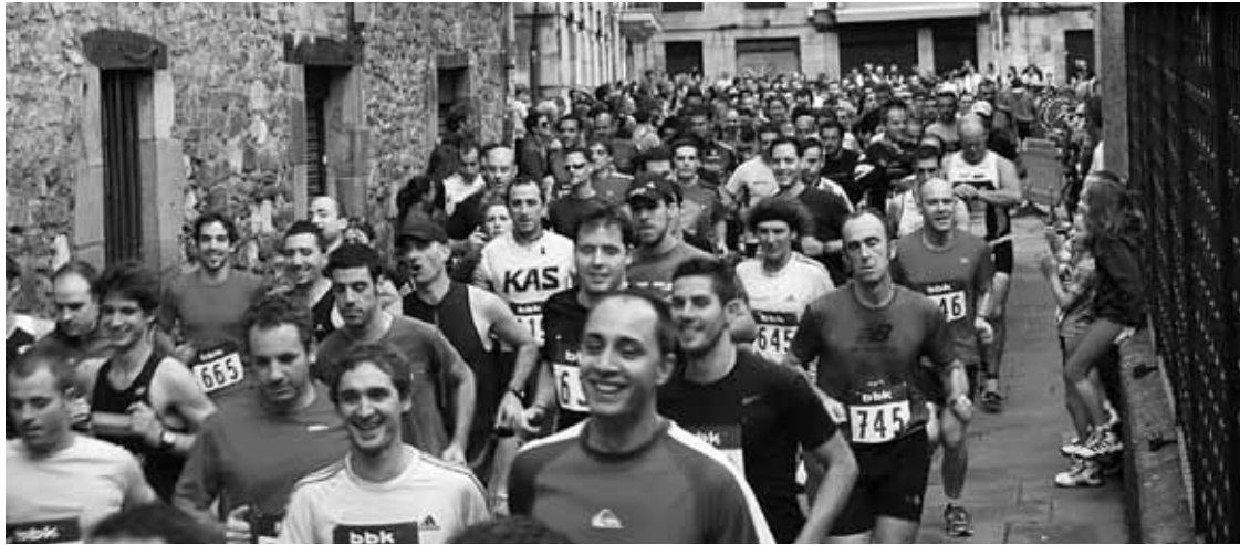
Durangoko duatloiko iazko une bat. MugarraTT.

Trafiko Zuzendaritza zorrotz jarri da, eta egun berean errepideko lasterketa bik ezin dutela bat egin esan du; litekeena da hainbat proba ezin antolatu izatea