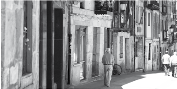
Udalak bere gain hartu du katastroa eguneratzeko ardura.

Ondasun Higiezin Zergan aurreikusitakoa baino 115.000 euro gehiago jaso ditu udalak