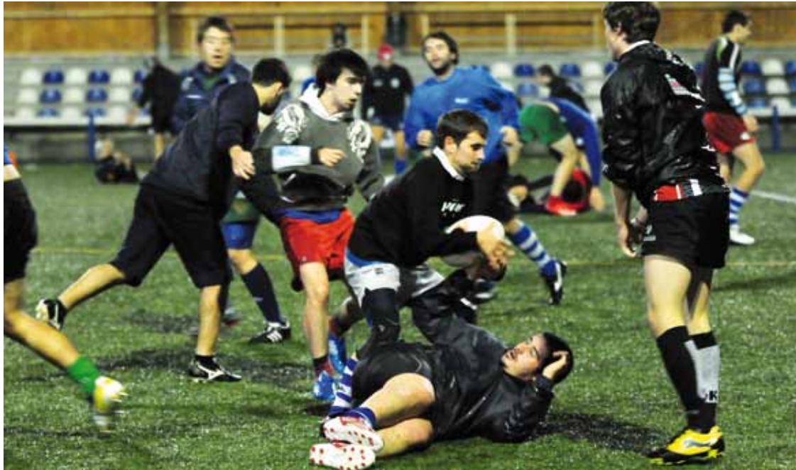
DRT B taldeko jokalariek entrenamendu saio batean. Kepa Aginako.

Biharko derbiak kolore hori-beltza du aurreikuspen guztien arabera; Elorrio hobeto dabil Euskal Ligako bigarren fasean, eta 10 puntu ditu; DRT B taldeak oraindik ez du punturik batu denboraldi osoan