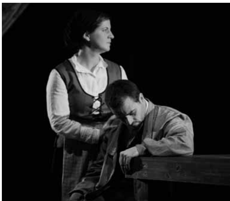
Urrian, Gernikako Lizeo antzokian estreinatu zuten ‘Guernica 1913’ lana.

‘Guernica 1913’ obratik eman diote Banarteri antzerki garaikidearen saria