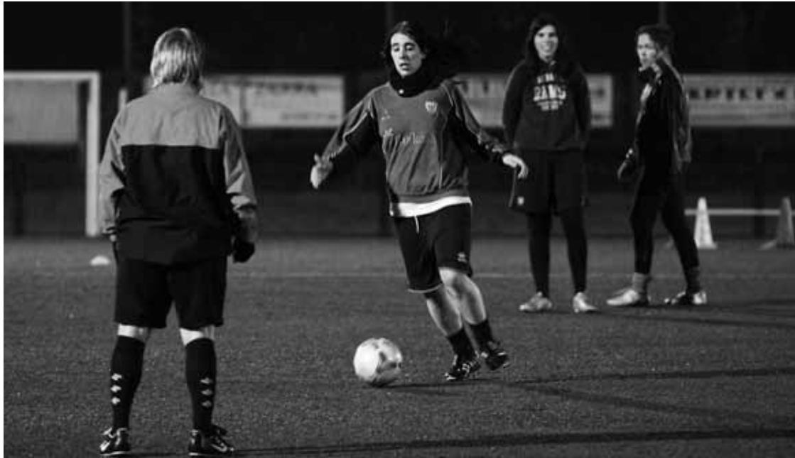
Iurretakoko jokalariek martitzen iluntzeko entrenamenduan. Kepa Aginako.

Igoera fasean goian dabil Elorrio, eta azken tokian Iurretako; hala ere, Elorrion ez dute euren burua faboritotzat jotzen: "Derbi bat beti da desberdina"