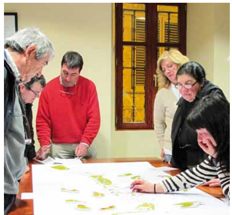
Joan zen egunean egindako tailerretan, herritarrek hausnartzen.

Diagnostikoaren eta lurren azterketaren ostean, egunean, partaide bakoitzak proposamen zehatza aurkeztu zuen. Jaiok azaldu du Lurralde Zati Planak asko mugatu duela. Esaterako, 80 eta 100 etxe artean eraikitzea aurreikusi dute. Hori bai, ahalik eta lur gutxien erabiltzeko helburuz, familia bakarrekoak barik, etxe blokeak izango dira.