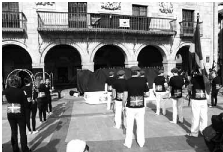
Dantzariak, eta udaletxeko balkoian Espainiako bandera kokatuta.

Segidan, udaletxeko balkoian erdian ipini duten Espainiako bandera ikurrina handi batek estali zuen bertaratutako txaloen artean, eta dantzari bik aurrekuia dantzatu zioten. Oihandi abesbatzaren doinuekin eta hainbat herritarrek prestatu eta zuzenean kantatutako bertsoekin amaitu zuten ekitaldia.