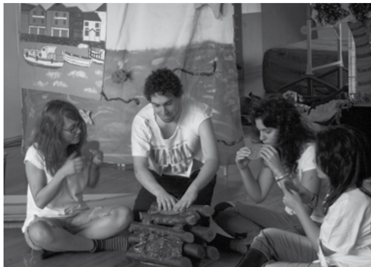
Ikastolan eskaini izan dituzte beste urte batzuetan emanaldiak.

da proiektu horren zatietako bat. "Hezitzaile profila lantzeko, oso inportantea da errealak diren egoerak planteatzea: benetak plaza bat eskainita, testuinguru errealean dihardute ikasleek. Bestalde, taldean egindako lana da, erronka bat daukate, eta ikuskizun osoa euren esku dago", dio Delgadok.