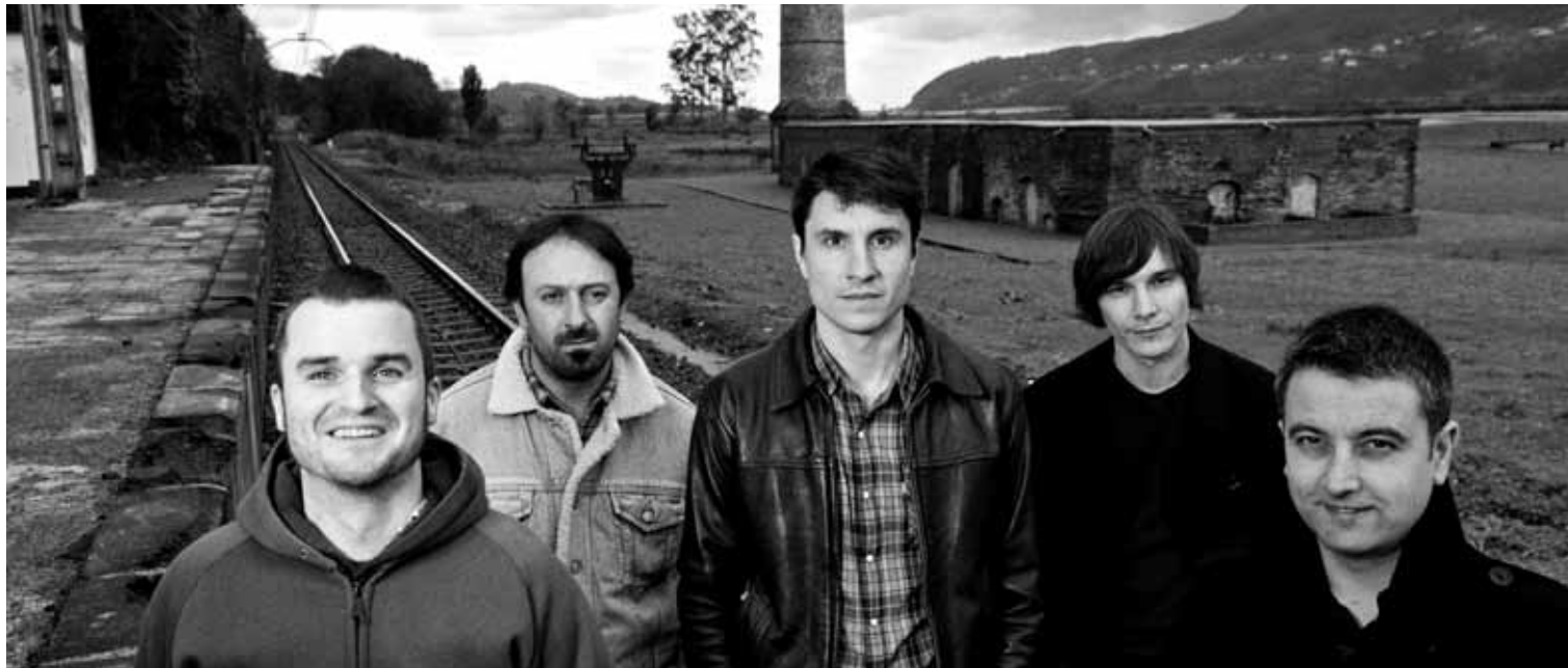
Abuztuan AEBetako WaterMusic estudioan grabatu zuen Audiencek ‘Big Affair’ azken lana.

Bihar, otsailaren 15ean, Durangoko Plateruenean kontzertua eskainiko du Audience talde gernikarrak