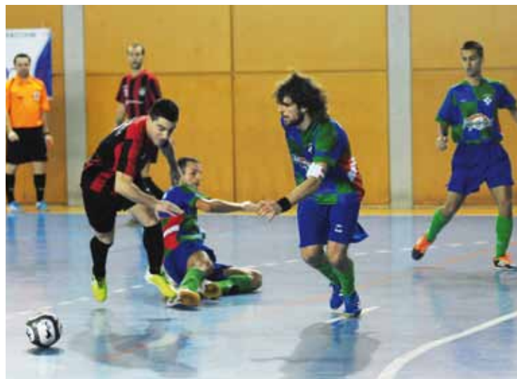
Sasikoak aurreko jokatutako partidu batean ateratako irudia. Kepa Aginako.

berbertan izango luke Sasikoak harrapatze aukera. Gainera, kontuan hartu behar da bigarren eta hirugarren sailkatuta dauden Bilbo eta Laskorain ere ez daudela urrun: Sasikoak baino puntu bat gehiago dute. Sasikoa bolada onean dabil, eta azken lau partiduetatik hiru irabazi eta bat berdindu ditu.