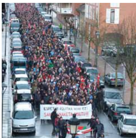
Manifestazio jendetsua egin zuten.