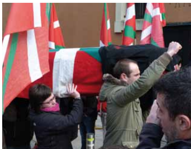
Bellonen gorpuari harrera egin zioten Arriolan.