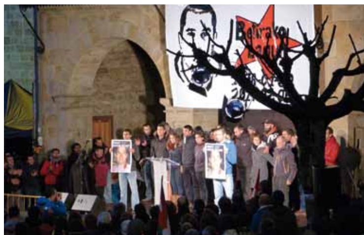
Senideak eta lagunak manifestazioaren amaieran.