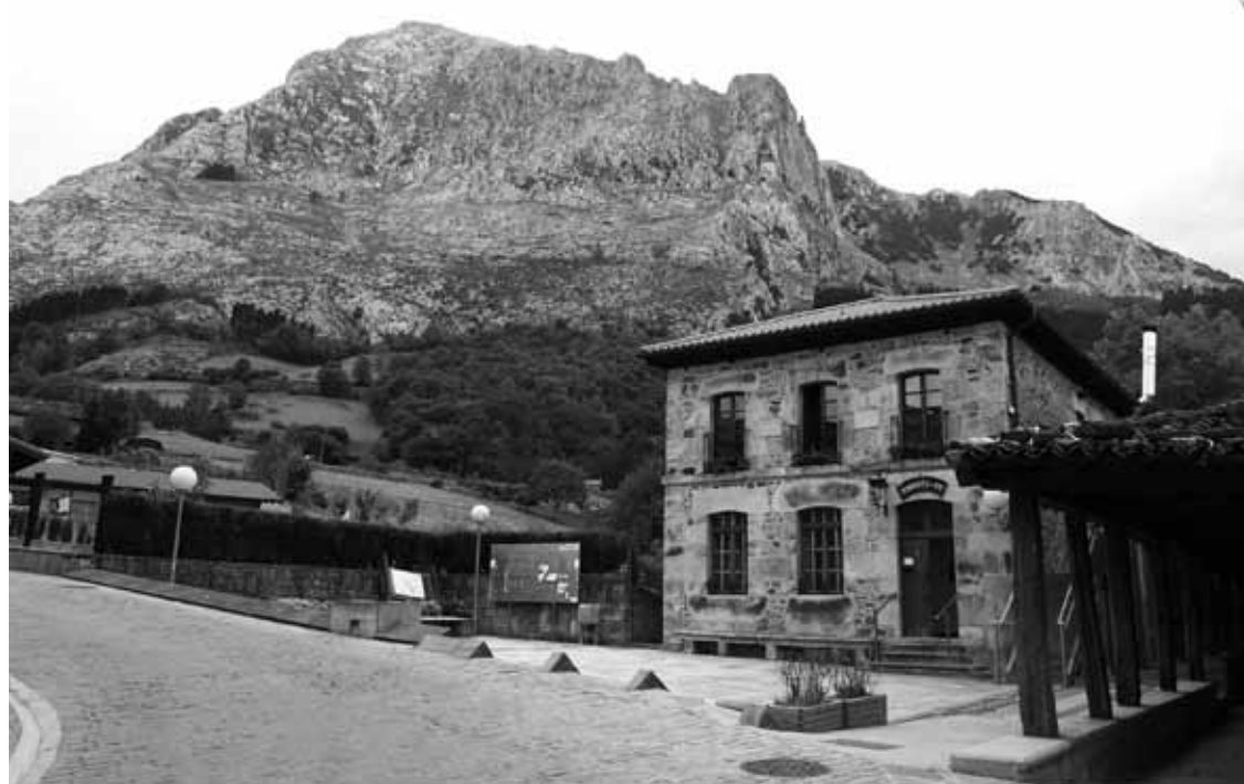
Anbotope elkartea Arrazolan dago, elizaren ondoko eraikinean.

EAEko Auzitegi Nagusiko epaiak dio eraikina “libre utzi behar dutela”