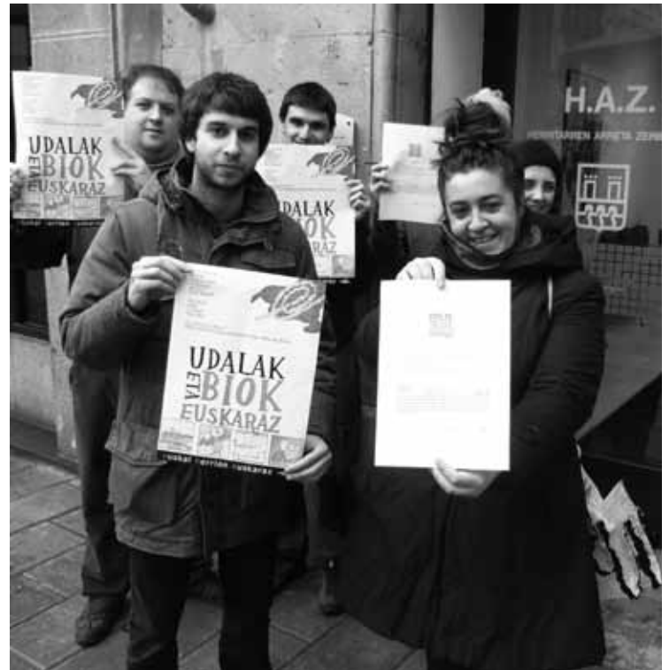
EHEko kideak, Herritarren Arretarako Zerbitzuan aurrean.

Martxoaren 6rako Tramitazio Eguna deitu dute; eskaerak era masiboan egingo dituzte