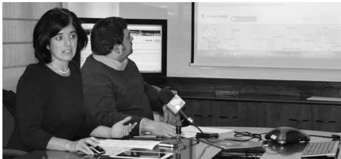
Naberan eta Ocejá, webgunea aurkezteko prentsaurrekoan.

Turismoak merkataritzan eragina izango duela uste dute webgune berriaren sustatzaileek, eta, horregatik, “bere kalitatea islatzen” saiatu dira argazki eta bideoen bitartez.