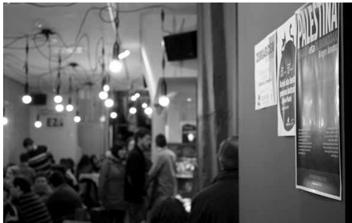
Iruñeko Katakarak proiektuaren argazkia.

Iruñeko Katakarak, Gernikako Astra, Euskal Herria Zuzenean festibala, Azpeitiko kultur mahaiak eta Gasteizko Hala Bedi izango dira protagonistak