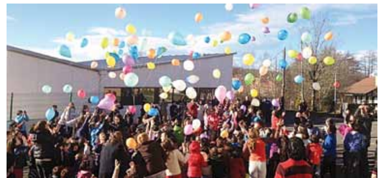
Koloretako puxika pila zerurantz, joan zen barrikuko Ametsaren Jaian.

le, irakasle eta gurasoen artean landutako flashmob bat grabatu zuten zazpi kameragaz, hurrengo egunetan editatu eta ikusgai ipiniko dutena. Bestetik, ikas komunitatea egitasmoa bideratzeko 707 ekarpen jaso zituzten. Orain, guraso, irakasle eta irakasle artean osatutako batzordeak ekarpenak lehentasunen arabera sailkatuko ditu.