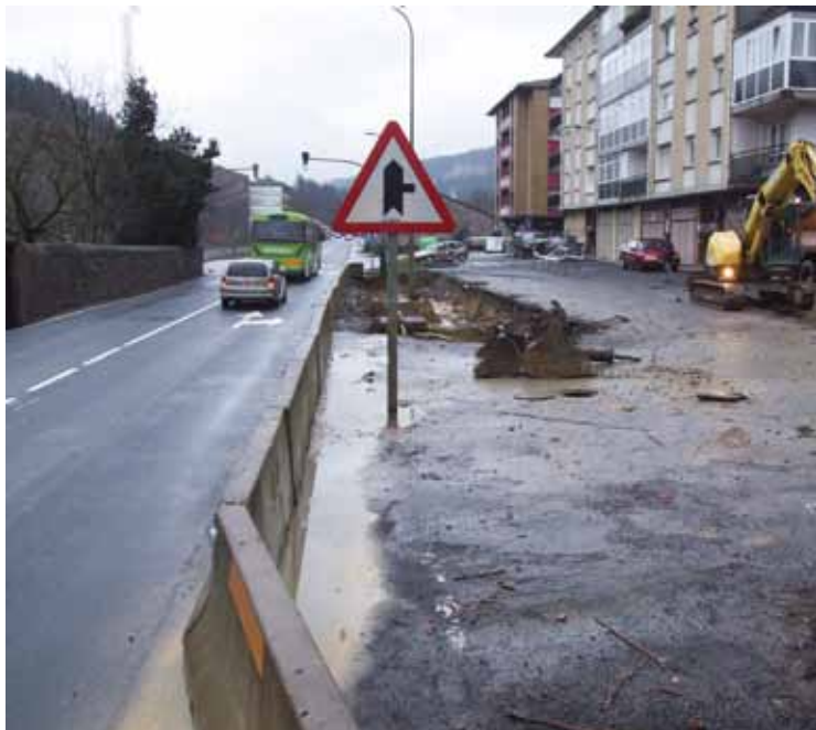
Autobus geltoki berriko lanak N-636 errepide ondoan.