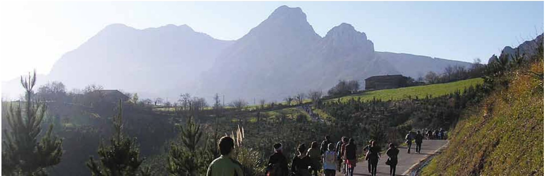
Iaz 350 ibiltarik eman zuten izena, Gerediagako baselizako irteera puntuan, Auzorik Auzo ibilaldian parte hartzeko.

Gerediaga auzoko Hamabi Harri auzo elkarteak antolatu du, bederatzigarren urtez, Auzorik Auzo ibilaldia. Urtarrilaren 26rako luzatu dute aurtengo hitzordua, San Blas jaien aurretxoko zita