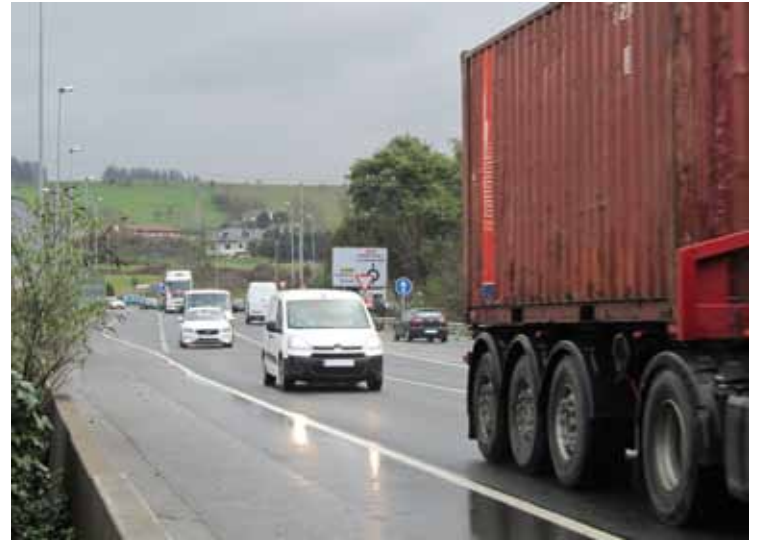
N-634 errepedeko trafikoa, lurretan.

Areitourtenak nabarmendu du ingurumenaren egoeran herritarrek daukaten ardura: "Orain dela bost urte erraza zen industriari errua botatzea, baina herritarrok gara kutsadura iturri nagusi bien erantzuleak".