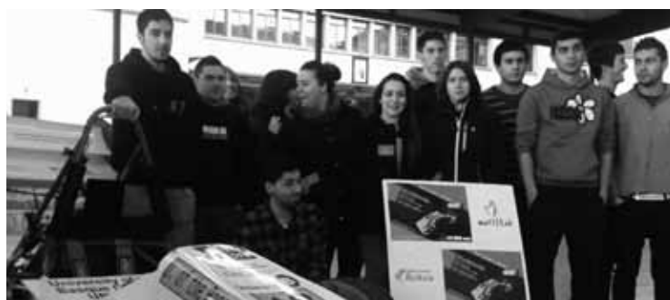
Formulako automobila ikusgai egon zen joan zen barikuan.