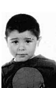
> Bost kandela enkargatzeko esan dizugu, baina ez Perales lez 'Un velero llamado libertad'. Urte bakoitzeko belaontzi bat jarriko duzu?