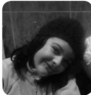
> Aita, ama eta Helenen partez zorionak gure etxeko sorginari!