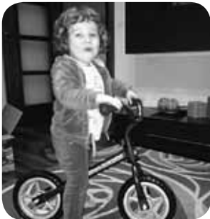
> Haizeak urteak egin zituen astelehenean, urtarrilaren 20an. Zorionak eta marrubizko muxu potolo bat etxekoekin partez!