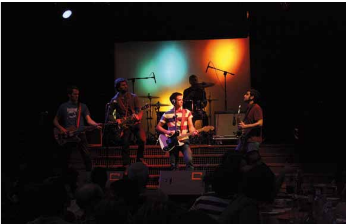
Ghetto taldekoak 2007tik dabilta batera.

Otsailaren 1ean Kilauea eta Bad Sound Systemegaz joko du Ghetto txosnetan