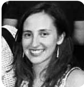
> Zorionak Oihanetxo! 22 mosu hippie, handi eta belarri tirakada beti edozertarako zure ondoan edukiko dozuzen kuadrillako sorginen partez!