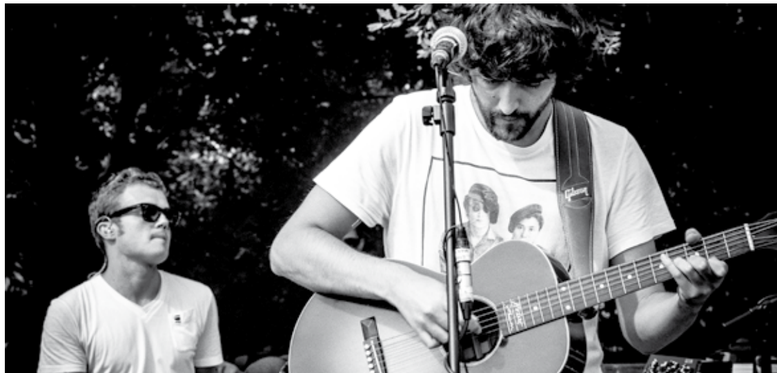
Hamarkada bat baino gehiago daramate taldekideek elkarrekin jotzen.

Hamarkada bat baino gehiago daramate taldekideek elkarrekin jotzen, eta azaroan aurkeztu zuten Warner ekoiztearekin kaleratu duten lehenengo lan luzea. Ordutik hona, kantarik eta diskorik onenen zerrendetan lehenengo postuetan aipatzen dute euren izena.