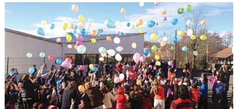
Koloretako puxika pila zerurantz, joan zen barrikuko Ametsaren Jaiak.

le, irakasle eta gurasoen artean landutako flashmob bat grabatu zuten zazpi kameragaz, hurrengo egunetan editatu eta ikusgai ipiniko dutena. Bestetik, ikas komunitatea egitasmoa bideratzeko 707 ekarpen jaso zituzten. Orain, guraso, irakasle eta irakaslearen artean osatutako batzordeak ekarpenak lehentasunen arabera sailkatuko ditu.