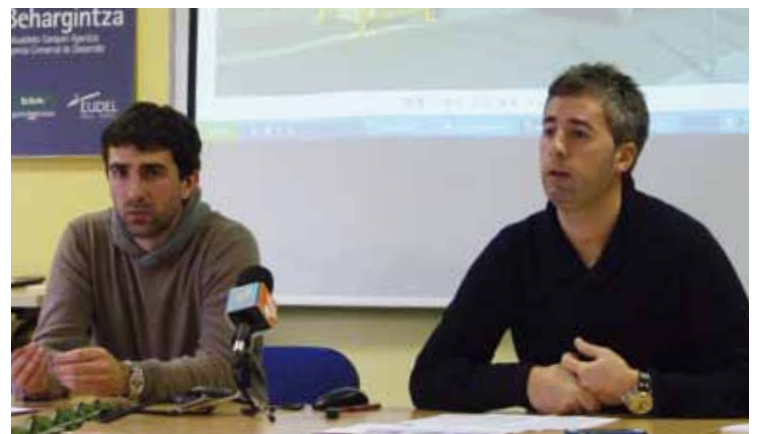
Airearen kalitatearen inguruko emaitzak eman dituzte asteon.