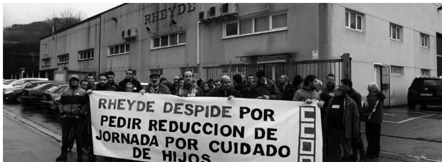
Hainbat behargin batu ziren atzo Goitondoko protesta ekitaldian.

Enpresak dioenez, zuzendaritzarengana “mehatxuzko jarreragaz” zuzendu zelako kaleratu dute