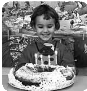
> Aste honetan ospatu dugu Garazik lau urte haundi bete izana. Zorionak polita, eta musu haundiak etxekoekin partez.