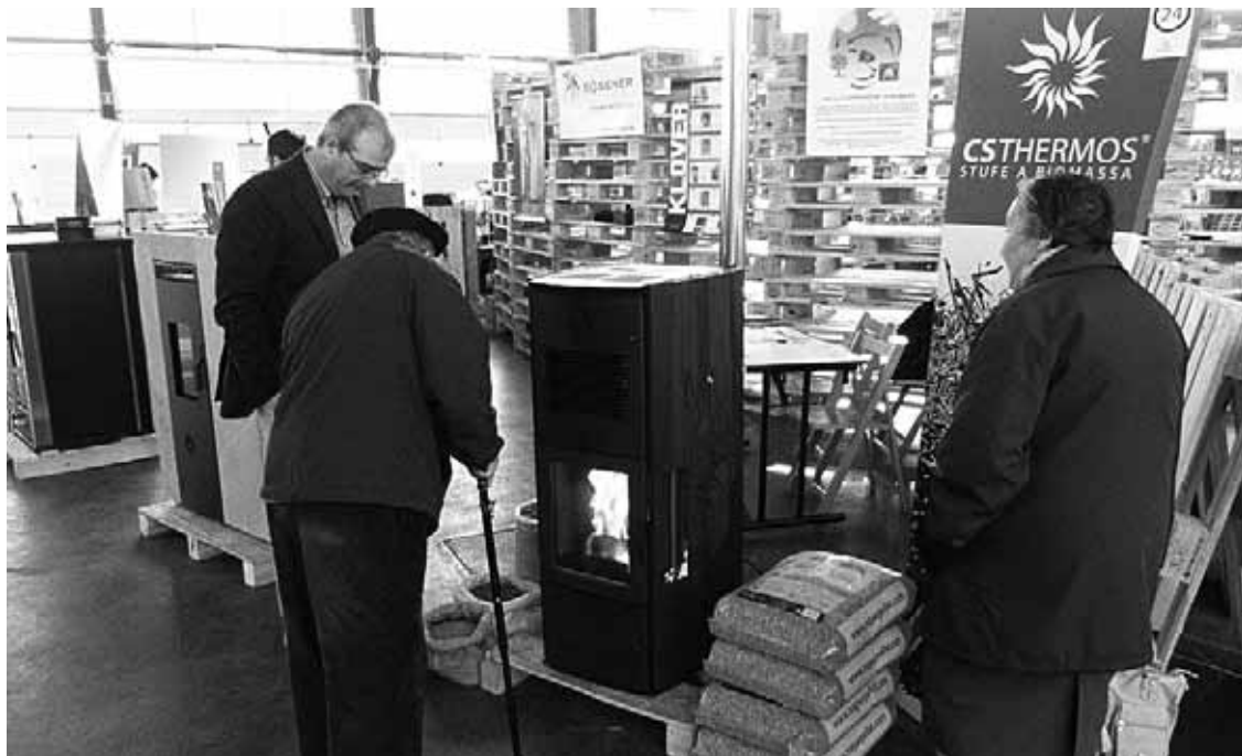
Iazko edizioa izan zen lehenengoa. Aurten 10.000 lagun batu gura dituzte Berdeago azokan.