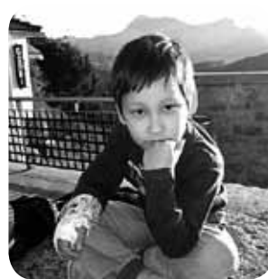
> Koldok , gure txapeldunak, sei urte bete zituen urtarrilaren 16an. Zorionak etxeko guztien partez, bereziki lehengusu eta lehengusiniaren parte!