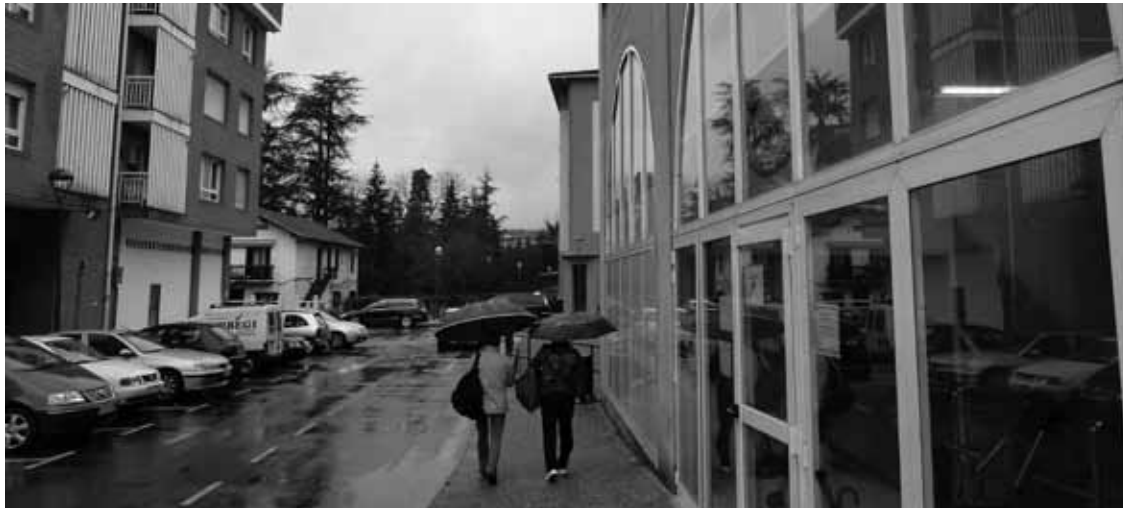
Kiroldegian 1.217 bazkide daude izena emanda une honetan.