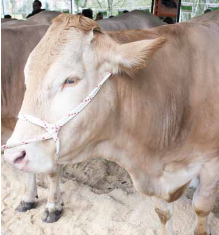
Abelburuen erakusketarako gunea ere atonduko dute.