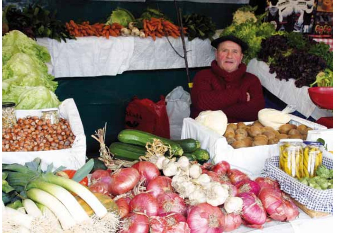
Abadiñoako ekoizleek izaten dute azokan parte hartzeko izena emateko lehenetasuna.