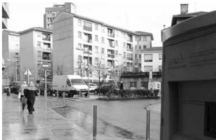
Iurreta aitzindari izan zen eskualdean olio batzeko erabilitako sistema jarrita.

sortutako hondakina da-eta ur kutsaduraren jatorri nagusietako bat”. Udaleko arduradunek azaldu dute olio litro bat kentzeak 2,50 euro balio dituela: “Beraz, estolderia sarearen mantentzean aurrezte garrantzitsua da. Araztegiaren ere kostu handia eragiten du etzeko olioak”. Iurretarren ahalegina zoriondu du udalak, eta birziklapena handitzea espero du.