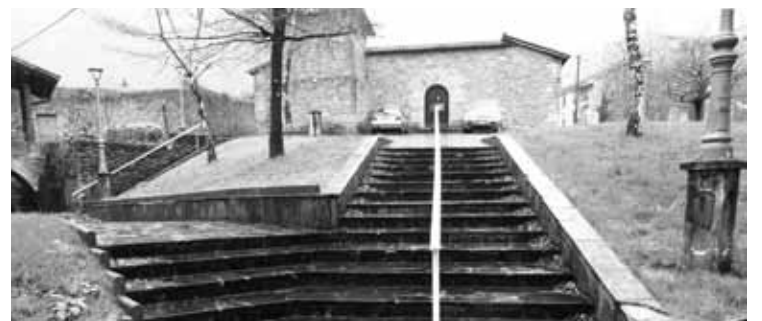
Kanposantuko sarbidea aldatuko dute, eskailerak eta arrapala erabilia.