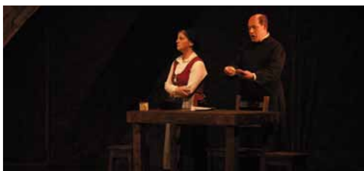
Gidoia idatzi zuen, eta antzezte lanetan ere badihardu Rafa Hercek.