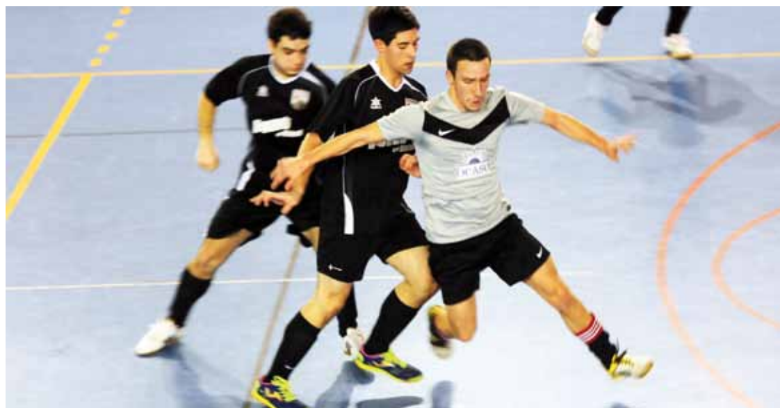
Joan zen asteburuan Gu Lagunak taldeak 1-2 galdu zuen Mendibeltzen kontrako derbia. Kepa Aginako.

Bihar derbia jokatuko dute Elorriko Txiki eta Gu Lagunak taldeek; Elorriko taldea aurten sortu dute eta lider dago; durangarrek sorpresa eman nahi dute