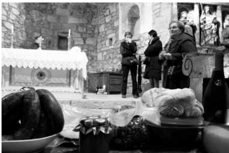
Herritarrek eliza barruan egin zuten apustu produktuengatik.

Normalean elizaren kanpoaldean egiten dute Erremata, baina haizearengandik babesteko barruan egitea erabaki zuten joan zen barikuan. Eliza barruko epelean egon ziren, eta neguko hotzari aurre egiteko moduko jakiak eroan zituen etxera hainbatek.