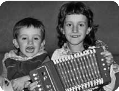
> Aupa bikote! Igatx eta Uxar trikitilari famatuaren urteak oraintxe izan dira eta etxekoekin partez musu erraldoi pila bana.