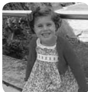
> Elenek lau urtetxo bete ditu. Zorionak printzesa! Musu handi bat familiaren partez, eta ona izaten jarraitu!