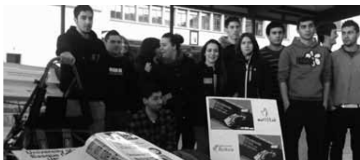
Formulako automobila ikusgai egon zen joan zen barikuan.