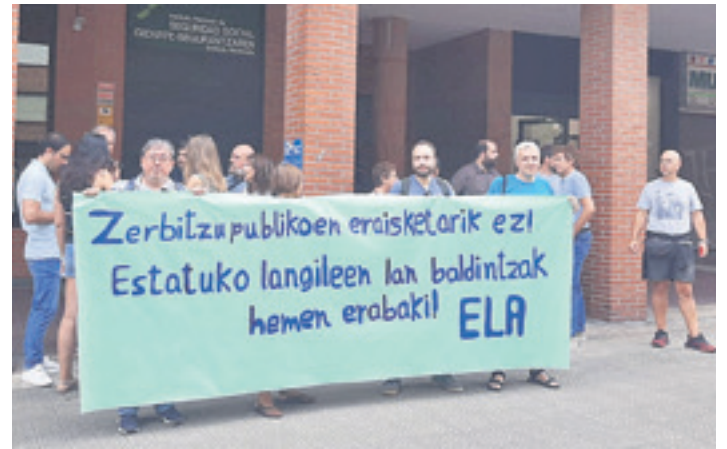
ELAren protesta joan zen barikuan, bulegoaren aurrean.

eskuetara igarotzea eskatu du ELAk, hau da, transferentzia egitea. Era berean, eszenatoki hori ailegatu bitartean, lanpostu eta hautaketa probetan lurraldetasunaren irizpidea kontuan hartzea exijitu dute: "Kontuan har daitezela Euskal Autonomia Erkidegoko eta Nafarroako errealitateak lanpostuak eskaintzerako orduan: langile falta, bizi-maila, hizkuntza...", esan du sindikatuak. Espainiako Gizarte Segurantzaren bulegoa Madalengan egon da oraintsu arte, Francisco Ibarra kalean.