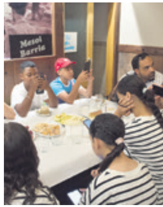
Mesoi Barrian armozatzen.