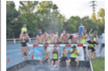
DKTko atletak, ospatzen. L.GORRIÑO

Durangoko atletismo pistan lehiatutako azken jardunaldian baturiko puntuei eskerrak, Durango Kirol Taldea seigarren urtez jarraian arituko da Lehen Mailan. DKTko atletek uretan amaitu zuten jardunaldia, bero itogarriari aurre egiteko ez ezik baita lorpena ospatzeko ere.