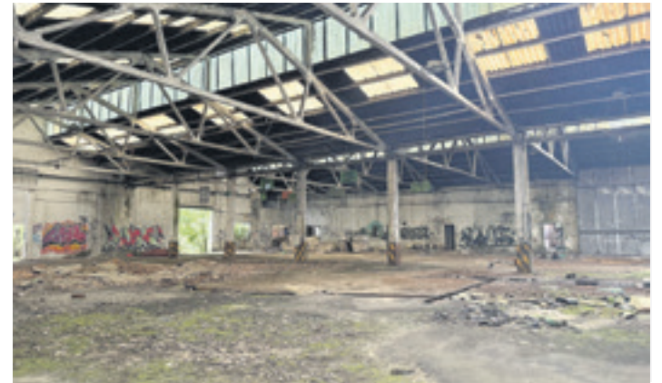
Fytasa enpresa hartzen zuen azpiegitura, gaur egun. ELORRIOKO UDALA

Jabetza eskuratu eta gero, udalak esan du "hurrengo urratsak lantzen" dabilela. Ingurumen Sailagaz hartu-emanetan egon da eta kutsadura kentzeko prozedura abiaraziko duen enpresa kontratatu du. Bulegoen eraikina "ahalik eta lasterren" eraisteko asmoa du, premiazko prozedura baten bitartez; izan ere, gaur egun pertsonak "modu irregularrean sartzen dira eraikinera, eta egoera arriskutsua