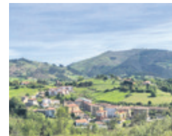
Mallabiko argazki orokor bat.