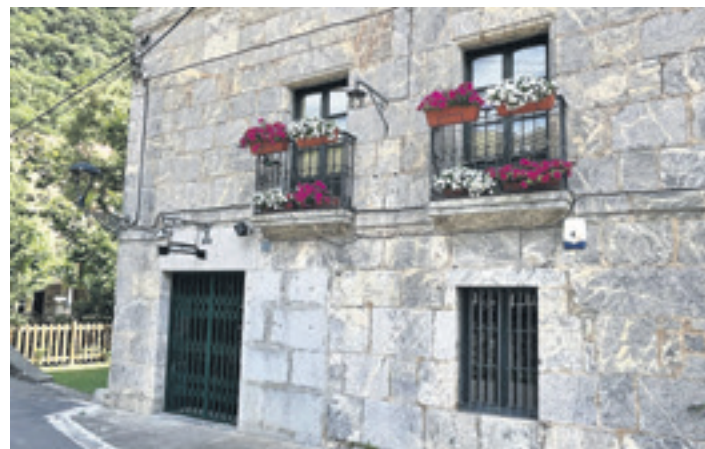
Proposamenak abuztuaren 3ra arte aurkeztu daitezke.