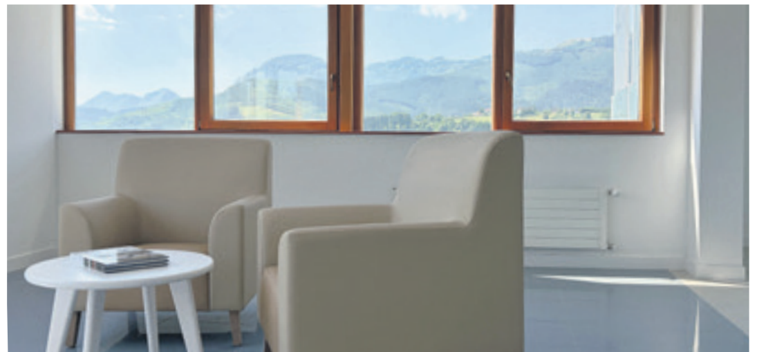
Egoitzako instalazioak etxe baten antzekoak dira.

Sare horren bitartez, tenperatura altuko aldietan erositako terminoak bermatuko duten guneak identifikatu gura dituzte, ura, gerizpea eta 26 gradutik beherako tenperatura dutenak, umeentzat eta adinekoentzat gehienbat.