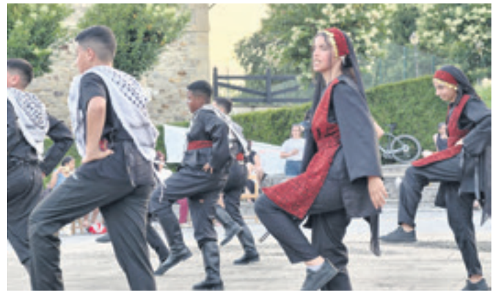
Dantza palestinarrek egin zituzten lurretako plazan. DURANGALDEA-PALESTINA