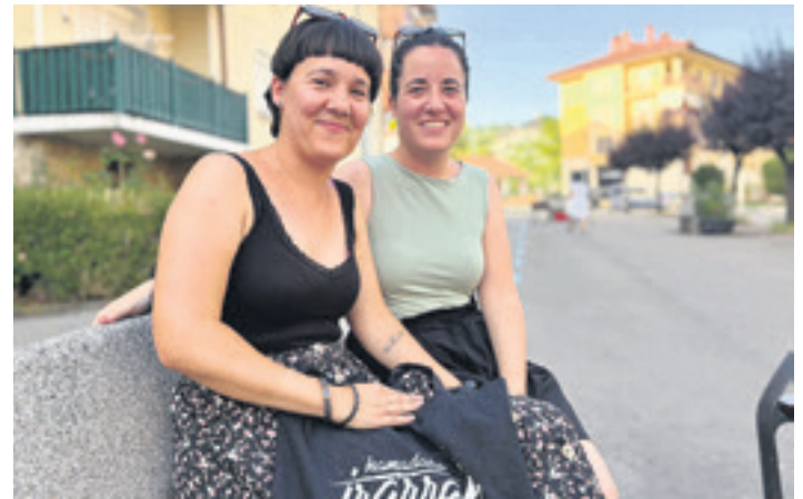
Hamadako Izarrak elkarteko arduradunak.

G.E.: Umeak izango dira protagonista, hango arazo politiko baten ondorioz euren herrialdetik irteteko premia duten umeak. Saharan errefuxiatuen kanpamentu bat dagoela gogoraraztea da gure lana.