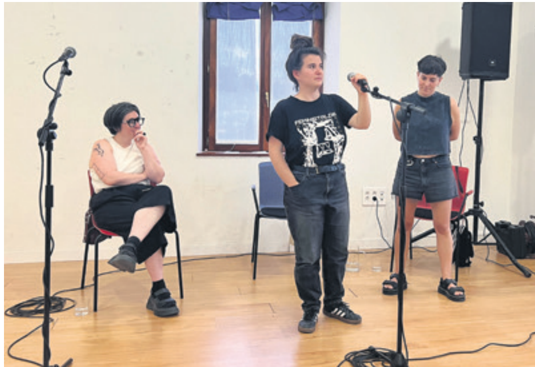
'beste zerbait' eleberriaren aurkezpena Mallabian. Arana eta Artetxe bertsoan aritu ziren, eta Sarriugarte gai-jartzaile.

Ba, ez dakit, egia esan. Kontakutako dizut orain arte jaso dudana feedbacka: parte bat espero nezakeena zen, liburuarekin lotura sentitu duen jendearena, identifikatu direnak hainbat motiborengatik. Hori niretzat oso pozgarria da. Hemen kontatzen diren gauzek oihartzun zabalagoak sortu ditzaketela uste dut, elkarrizketak elikatu ditzaketela. Baina kontrako iritzia ere jaso dut, deserosoa egin zaion jendearena. Hori ere eskertzekoa da, esan nahi duelako liburua ez dituela indiferente utzi. Zerbait ukitzen baldin badu, niretzat opari handia da.