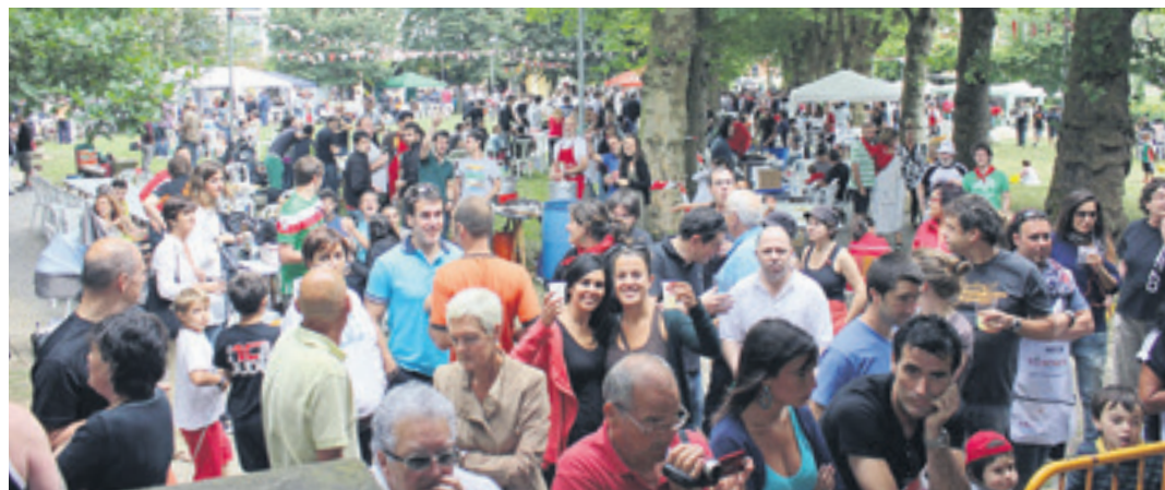
Tabira auzoko jaietako argazki bat.