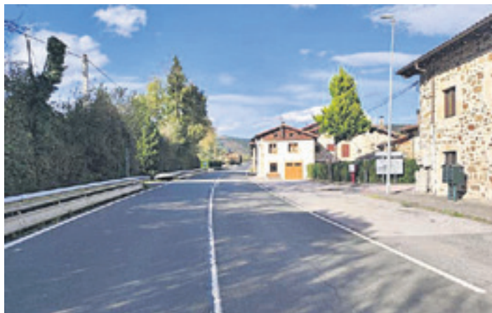
Anteparaluzeta auzoko artxiboko irudi bat.

Eusko Jaurlaritzako Segurtasun Sailak radar finkoa ipini du Anteparaluzetan, trafikoaren segurtasuna indartu eta bide horretan gertatzen diren arrisku egoerak murrizteko. "Auzokoen eta bertatik igarotzen diren herritarren segurtasuna hobetzea da helburu nagusia", esan dute udal arduradunek.