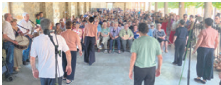
50 urte eskola euskalduntzen egon den lantaldea

OTXANDIO Euskaraz irakasten hasi zirela 50 urte bete izana ospatu zuten Otxandion, joan zen asteburuan. Inkernuz erein lelopean, ekintzen bateriko egitaraua osatu zuten. Egitarau horren barruan, omenaldia egin zieten ikastola sortzen lagundu zuten 50 pertsonari.