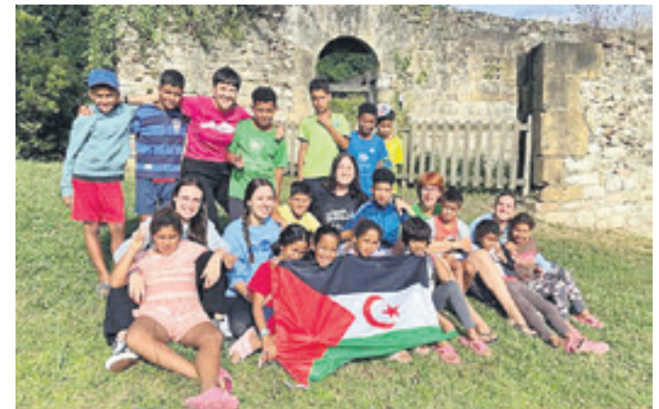
Aljeriako errefuxiatuen kanpalekuetatik ailegaturiko ume sahararrak, Olazarren.