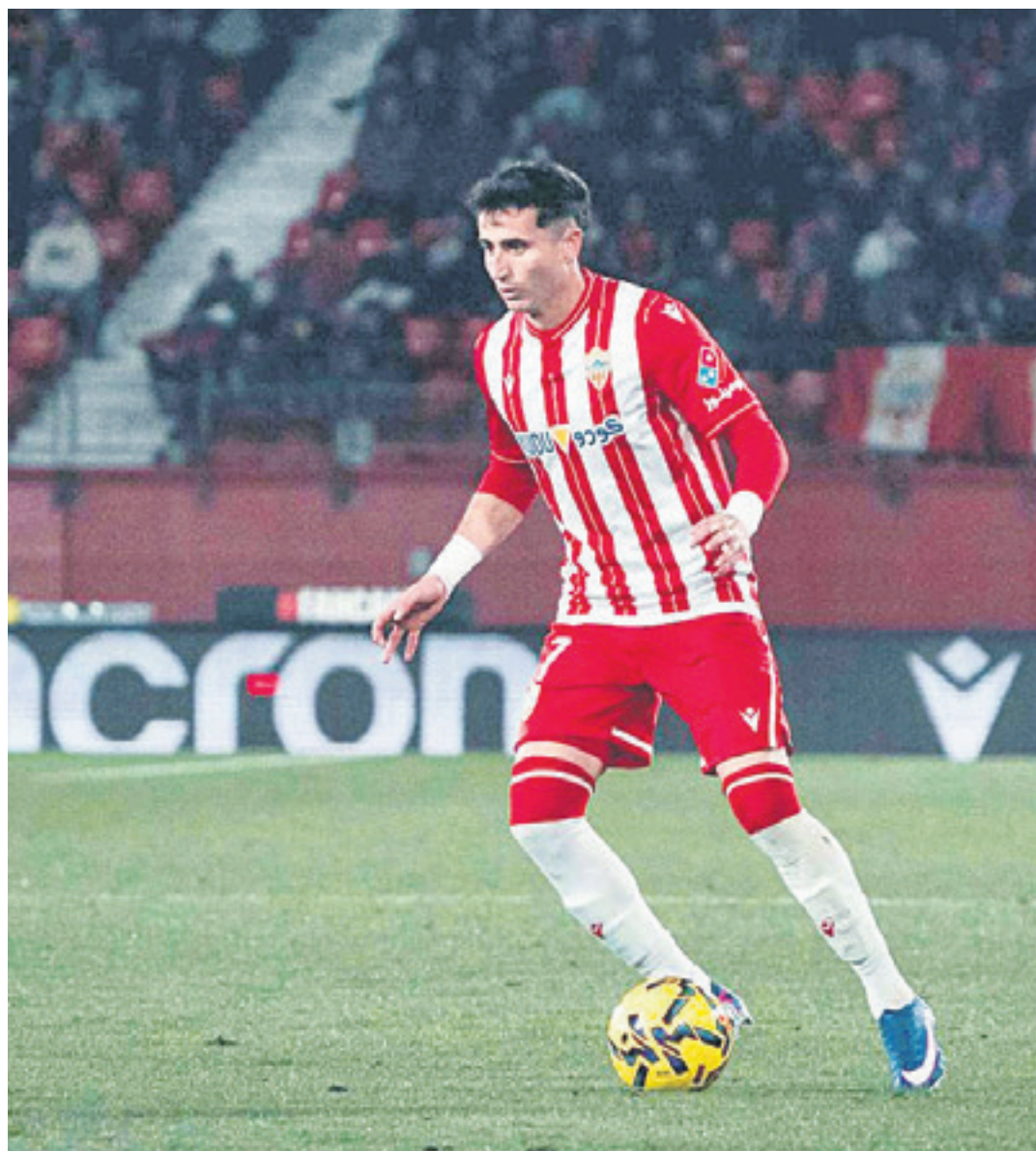
Beste lau urterako kontratua du Almeriagaz.

Ezin izan du Lehenengo Mailarako igoera lortu Almeria taldeagaz. Hala ere, jokalaria zornotzarra kolpetik errekuperatu eta datorren urtean berriro saiatzeko prest dago