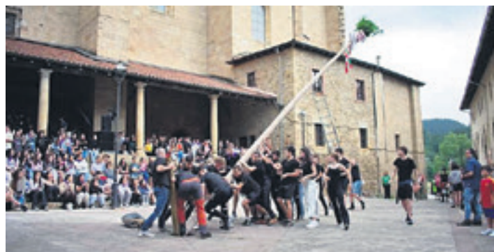
lazko jaietako argazki bat.

jaiak. Ohikoa duten moduan hasiko dituzte jaiak, beste urte batez: kartel egileari saria banatuko diote, sardina-jana egin-