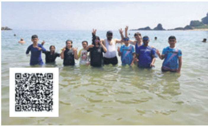
Lehenengoz hartu dute bainua itsasoan, Ondarroan. DURANGO-PALESTINA