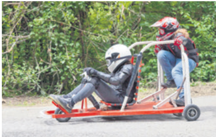
2024ko Zaldibarko goitibehera jaitsiera. ALDATSA ELKARTEA

du duten herrikide guztiei. "Bolutario ugari izan dugu bidean, eta lan handia egin dute. Denei eskerrak eman gura dizkiegu", zehaztu du. Elkarteko kideek material guztia Berbarori eman diote, dohaintzan.