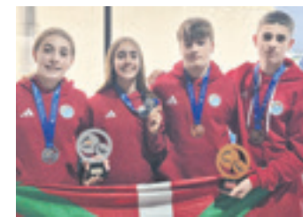
Domina irabazi duten gazteak.