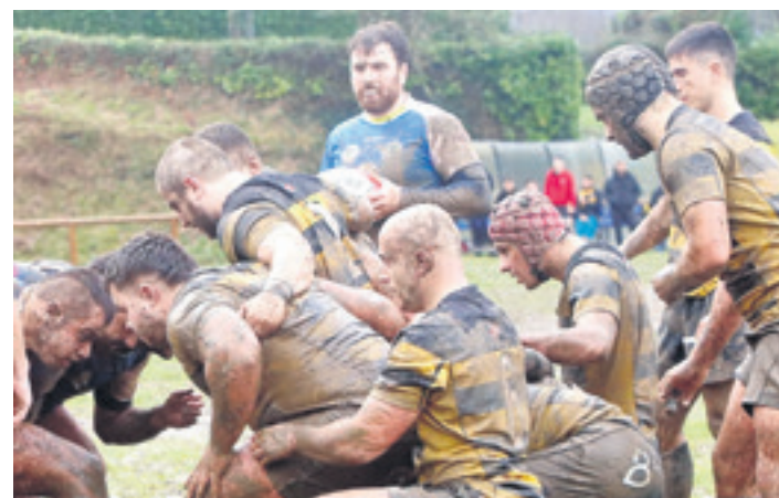
Betsaide Elorrio taldeko errugbilariak ligako partidu batean. ELORRIO RUGBY TALDEA

Emakumeetan, Elorrioko, Urgozoko eta Arrasateko neskek osaturiko Geurea taldea Euskal Ligako lider dago liga amaitzear dela, eta kanporaketa jokatuko du. Kasu honetan, maiatzaren 17an hasiko dira kanporaketak.