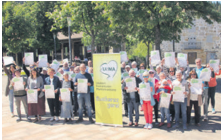
UEMA Egunaren aurkezpena, Otxandion. UEMA

euskara zinegotziaren berbetan, "ilusioz aritu gara lanean, herriko elkarte eta eragileekin batera, eta ilusio horretara batzeko deialdia egin gura diegu euskaldun guztiei". Egun osoko egitaraua antolatu dute.