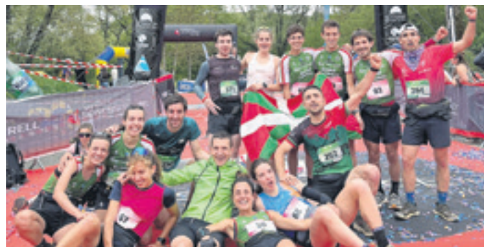
EUSKAL MENDIZALE FEDERAZIOA.

DURANGALDEA Mendi korrikalari otxandiarra eta durangarra Frantziako estatuko Alpeetan lehiatu dira asteburuan, Euskal Selektzioagaz. Uribe hamazazpigarren geratu da emakumezkoetan, eta Cebrian hogeita laugarren gizonzkoetan.