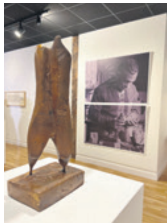
Erakusketako eskultoretariko bat.