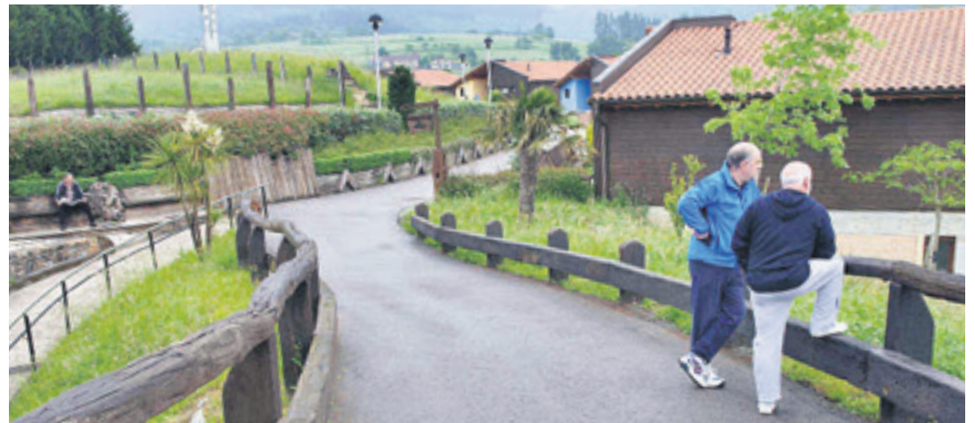
Aldi baterako egonaldiak mesedegarriak dira zaintzailearentzat nahiz mendekotasuna duen adinekoarentzat.

ra eta lurra behar den moduan egokitzen. Behin lan horiek amaituta, kalabaza eta arto poteak etxera eramango dituzte, han hamabost egunean zaintzeko. Ondoren, ekainaren 6an, umeek ortura bueltatuko dira poteetan ernaldutakoak lurtean sartzera. Domekako hitzordua txorimalo berri bat egiteko ere aprobetxatuko dute.