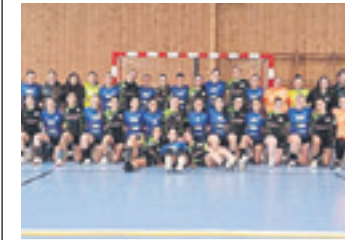
Basauri, Matienako finaleko irabazlea.

Zapatu honetan, eskubaloia protagonista izango da beste behin ere Durangaldean. Apirilean, Traña-Matienako kiroldegiak Bizkaiko eta Gipuzkoako ligetako bi talderik onenak batu zituen Euskal Ligara igotzeko partiduan. Orain, Durango Landako Kiroldegiak hartuko du lekukoa, haur kategoriako Bizkaiko finalekin. Abagune hori aprobetxatuta, Ibaizabal Eskubaloi Taldeak eta Bizkaiko Federazioak eskubaloia inguruko festa antolatu dute, hainbat erakunderen laguntzagaz. 10:30etik 11:30era hainbat jolas egingo dute, musikaz lagunduta. Finalei dagokienez, nesketan Muskizek eta Kukullaga Etxebarri neurtuko dituzte indarrak, 09:30ean. Mutilen finala Trapagan eta Basauri taldeen artekoa da. 12:00etan izango da.