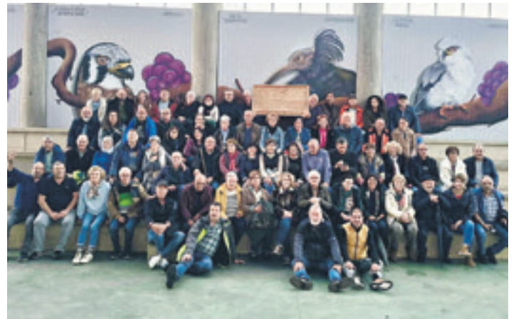
luz Lantziegon ateratako argazkia.

Garaiko eta Lantziegoko udalak 2013an senidetu ziren, udal biek sinaturiko akordioaren bitartez. Hori horrela, urte batean Garaiko herritarrek Lantziegora joaten dira, eta hurrengoan Lantziegokoak Garaia etortzen dira, senidetza akordio hori urtero-urtero berrituta.