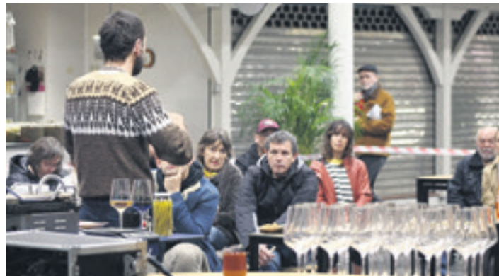
Dastatze bat Durangoko merkatuan. DURANGALDEA ELIKADURA