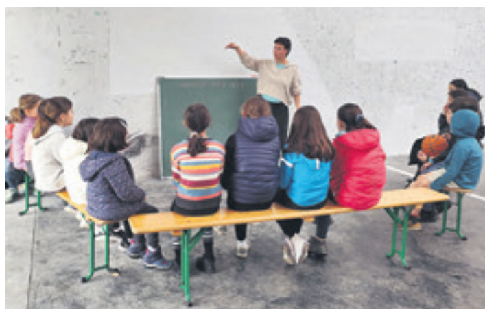
Umeentzako ekintza bat Garaiko frontoian. TRUMOITTE