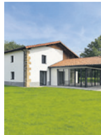
Honela berrituko gura dute Kapitanena.