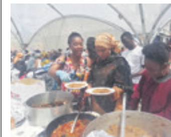
Munduko Arrozen Eguna. ARTXIBOA