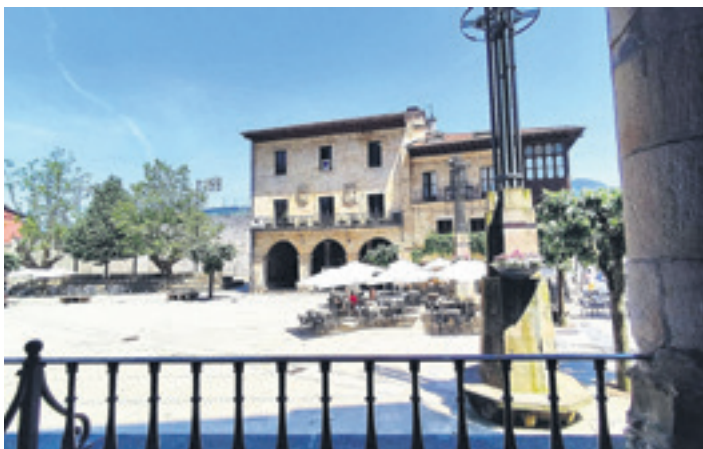
Elorrioko 26 komertziok bat egin dute kanpainagaz aurten.

Herritarrek deskontuak baliatzeko aukera dute atxikitako establezimenduetan