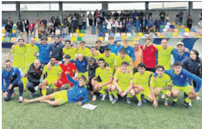
SD Amorebietako taldea ligako azken partidua amaitu eta gero. AMOREBIETA

Errege Koparako sailkapenak aho zapore gozoa utzi die zaleei, azken uneko lorpena izan delako. Amorebietak etxeko lanak egin zituen Nafarroan, Multive-