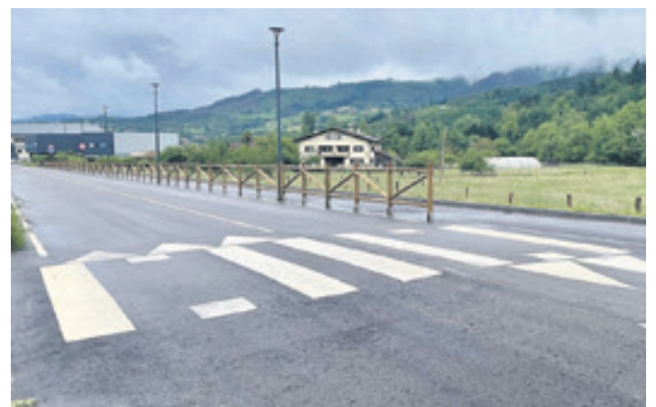
Urkizuaran kale eraberritua.

Lanen kostua 714.000 eurokoa izan da eta horietatik 506.314 euro Aldundiak ipini ditu, udalak ohar batean azaldu duenez. Oinezkoen segurtasuna hobetzeko, errepidea estutu dute, autoen abiadura murrizte aldera. Bestalde, oinezkoen tartea berria hesiz babestu dute. Irisgarritasuna hobetzeko, zebrabide goratuak ipini dituzte.