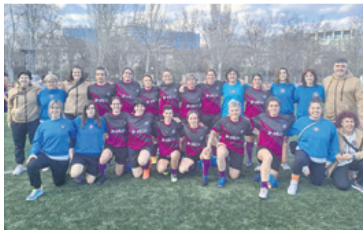
Hazi Berriak taldeko kideak ekimenaren antolaketan aritu dira.

Lehiatuko diren sei taldeetatik bi eskualdekoak dira: Hazi Berriak eta Erein