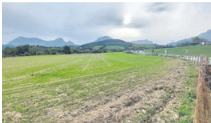
Eguzkitzan egingo dituzte ortuak.