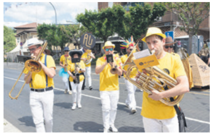
Traña-Matienako jaietako lehenengo asteburuko argazki bat.

Azterketako datu guztiak kontuan hartuta, gobernu taldeak adierazi du aurrera begirako bide orria markatuta dutela. "Emaitza horiek erakusten dute etxebizitza politiketan gogor lan egiten jarraitu behar dela, etxebizitza eskuratzeko zailtasunei erantzuteko; batez ere, gazteen artean. Beharrezkoa da alokairuaren eskaintza eskuragarriagoa izatea eta udalerriko errealitateetara hobeto egokitutako eredu baterantz aurrera egitea", esan zuten udal gobernu taldeko kideek.