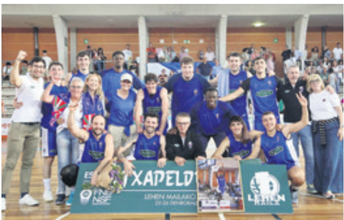
Tabirako-Baqueko jokalarik eta kideak garaipena ospatzen. LUIS ITURRIOZ