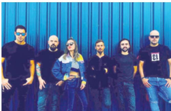
Sweet Rage talde abadiñarra da lehiaketan parte hartuko duen taldeetariko bat.