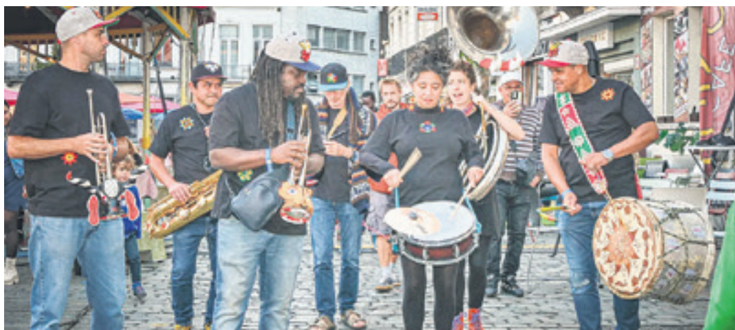
Belgikako Banda Quetzal taldeak Mexikoko herri musika eta ukitu indigenak plazaratuko ditu Zornotzan. BANDA QUETZAL